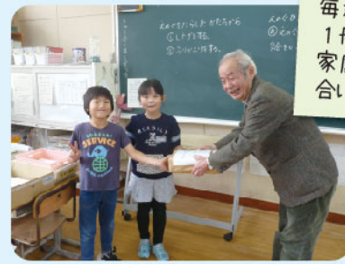
細井会長より、社協文庫を贈呈

読み聞かせをしたり、子どもが手に取れるように図書コーナーに置いているので喜んで読んでいる。(小学校より)