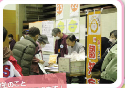
福祉のこと なんでも相談できます！

屋内には26ブースの出展があり、日頃の活動展示コーナーや体験コーナー、福祉相談会、子ども達も楽しめる輪投げ、工作、魚釣りゲームが行われ、会場いっぱいの人で賑わいました。