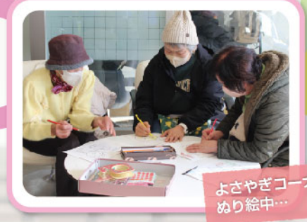
よさやぎコーナー ぬり絵中...